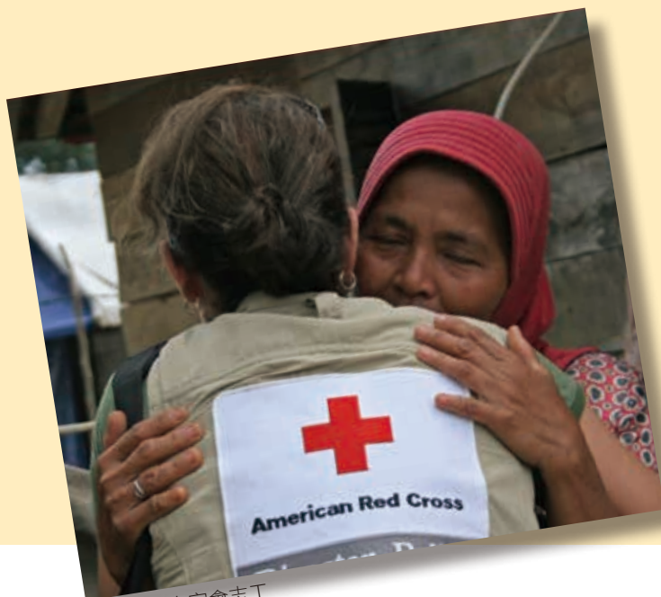
■ 美國紅十字會志工