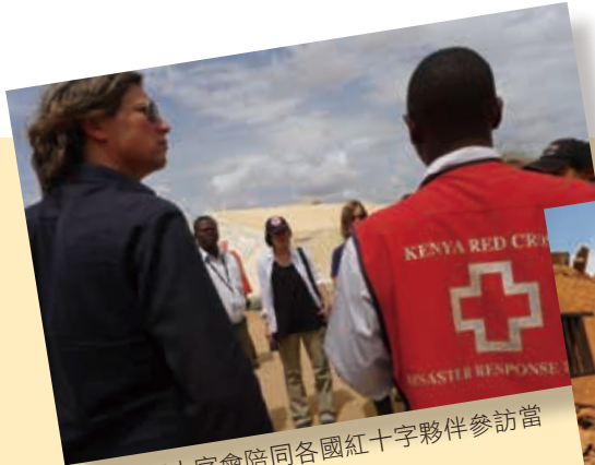
■ 肯亞紅十字會陪同各國紅十字夥伴參訪當地難民營