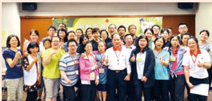
■本會照服員訓練班向心力十足

中高齡轉業原本就大不易，這次的照服員訓練班，我們看到6位20至30多歲的年輕一代有意投入長照產業，而到場參與媒合求才的廣和順、恆安、合安心、惠明、中化及優照護Ucare等多家業者，也都使出渾身解數、積極搶才。+