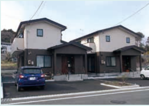
■吉里吉里C1公營住宅