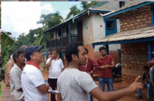
■ 尼泊爾耐久屋，採自力造屋模式援建