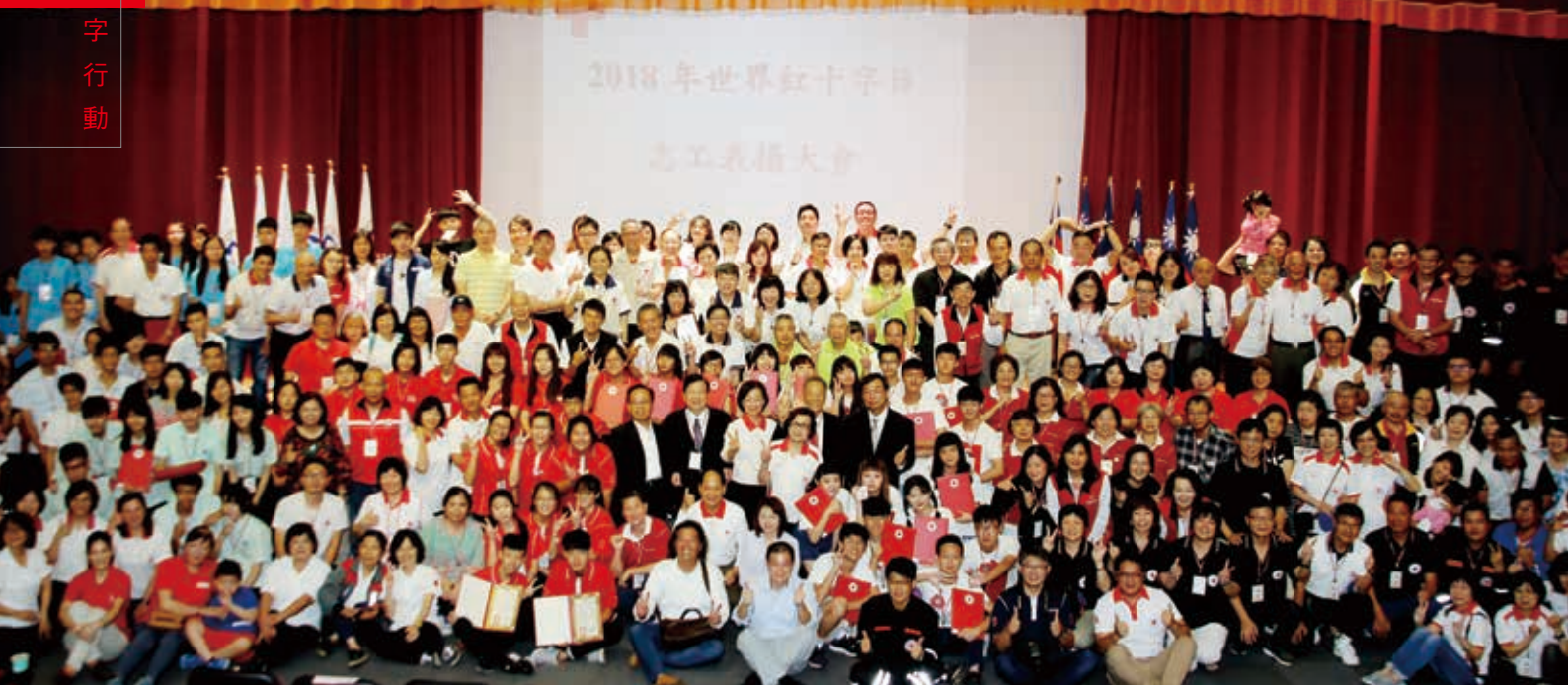
■數百志工齊聚一堂慶祝世界紅十字日