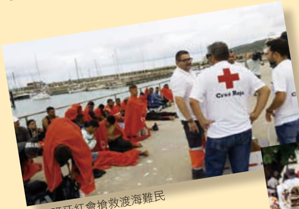
■西班牙紅會搶救渡海難民