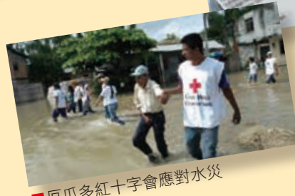
■厄瓜多紅十字會應對水災