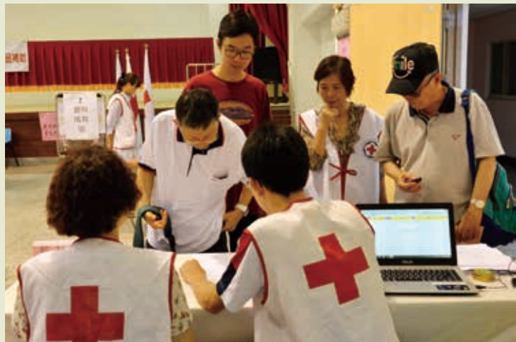
■5月7日第3梯次發放慰助金