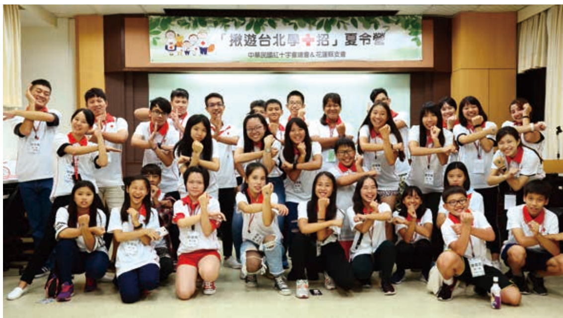
■揪遊台北學+招夏令營，讓孩子收穫滿滿

為了關懷0206花蓮地震災區學子，本會除了提供教育補助外，特別開辦「揪遊台北學+招夏令營」。夏令營規畫了讓孩子們在遊憩休閒中學習防災急救、人道體驗、關懷社會等動靜皆宜的各式課程，同學們玩得開心也學得用心，個個帶著滿滿的人道體驗歡喜返家！