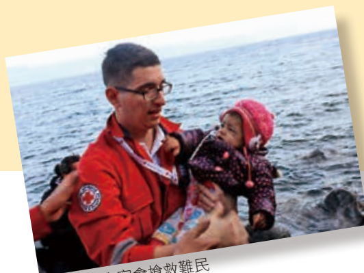
■ 希臘紅十字會搶救難民

但在台灣，我們不難發現，有些廠商、企業、組織或機關(構)，使用「+」紅十字這個特殊標誌於非供人道使用的商品或服務，或連同其他文字或圖形，向經濟部智慧財產局（以下簡稱智財局）申請註冊於茶葉、糖果、餅乾、糖漿、咖啡、果汁、汽水、薑湯、奶油、奶粉、布料、毛巾、保全、診所、醫院、銀行、安親班、化妝品、保養品、化學品、餐飲店、按摩器、美容諮詢、心理諮詢、肉類製品、化學試紙、保健食品、健康照護、醫療器具、鎖具鎖業、幼兒服務、動物醫院、融資服務、金融諮詢、坐月子中心、進出口服務、醫療儀器租賃、電腦軟體設計、防盜器材的安裝維修等各種商品或服務，並用在各種行銷管道上，有些並經智財局核准註冊專用。這其實都已違反日內瓦公約、國際紅十字與紅新月運動章程的規定及智財局有關保護紅十字國際委員會 (International Committee of the Red Cross, ICRC) 的「+」紅十字特殊標誌的解釋。