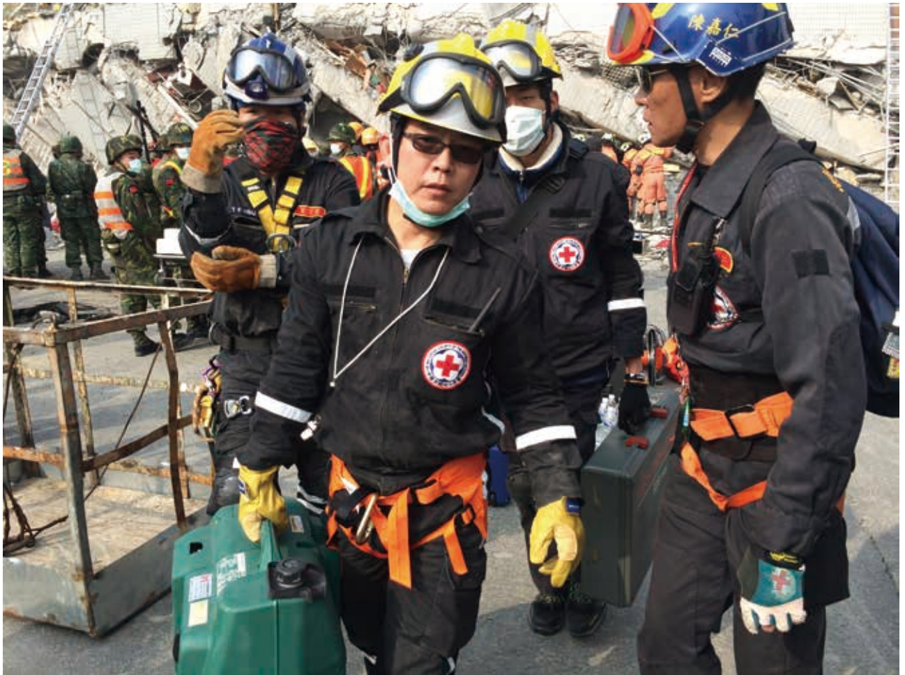
■為了搶救生命，英勇的黑衫軍不怕苦不喊累