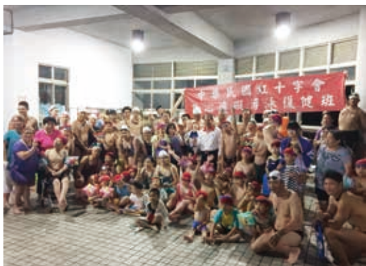
■總會107年第1期身心障礙者游泳復健班

紅十字會總會107年第一期「身心障礙者游泳復健班」5月9日開班。為期4週的時間中，78位小朋友在57位專業志工教練陪同下，每週三、五傍晚6點30分到9點30分，在新北市土城區清水高中游泳池，自在悠游復健，達到肢體放鬆、心情解放！