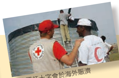
■德國紅十字會於海外賑濟