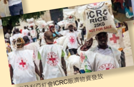
■奈及利亞紅會ICRC賑濟物資發放