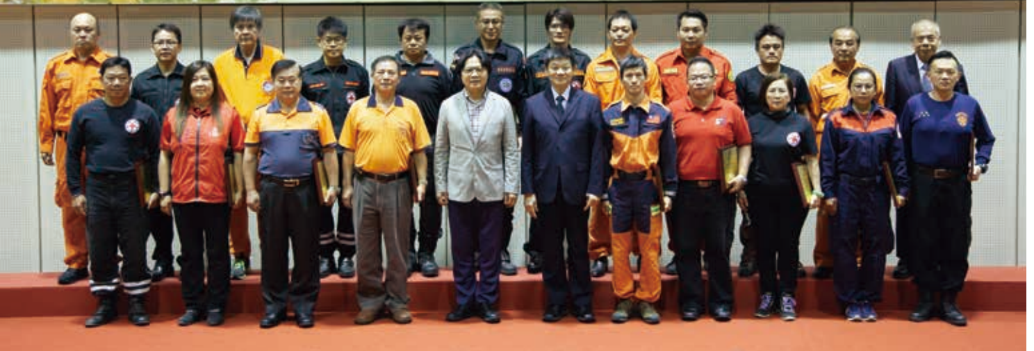
■花蓮震災紅十字會救災隊接受內政部表揚

梯次各式慰問金及教育補助發放，並委由學校統籌辦理教育補助，核准46件申請案，補助範圍涵蓋幼兒園至大學(幼兒園3案、國小14案、國中9案、高中9案、大學11案)，發放金額108萬元。