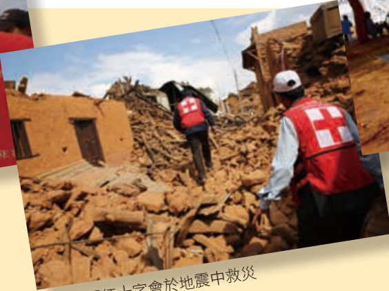
■ 尼泊爾紅十字會於地震中救災