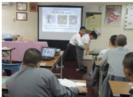
■講師教授哈姆立克急救法