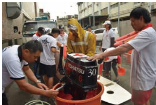
■舷外機的清洗吃重又花時間

從16日一早，紅十字會水安志工已在大佳河段集合完畢，並著手整裝、試船，完成勤前教育、接受總指揮分配勤務後，隨即就定位，在河面上聚精會神，關注現場狀況。水安守護行動即即展開，志工教練一一乘坐動力救生艇出航守護任務。志工們頂著烈日，每艇2人搭乘動力救生艇，在河面上定點執勤，全神貫注巡視河道每個角落，全心守護著每一位參賽者的安全！志工們分成上、下午兩班，每班次值勤4小時。每年端午嘉年華活動現場本會水安