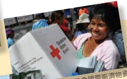
■德國紅會國際賑濟物資