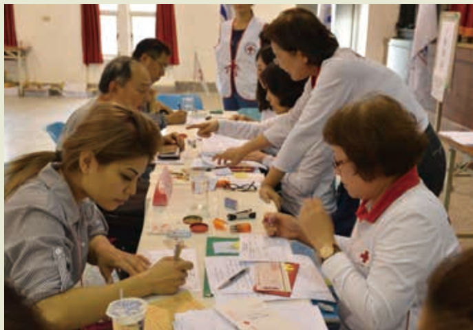
■4月2日第2梯次發放慰助金

花蓮強震發生後，本會於第一時間動員救災隊及同仁84人全力投入救災60小時，支援關聖帝君廟、花蓮小巨蛋及中華國小等臨時收容所棉被340床、毛毯280件、睡袋40個、日用品144組及帳篷23頂，並於災後積極開展賑濟復原重建計畫，除了火速完成誠信營區整修及設備添置，提供災民中期安置處所；完成5