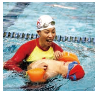
■志工教練一對一亦步亦趨地耐心帶領學員習慣水性