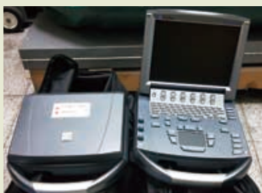
■ 攜帶式彩色超音波