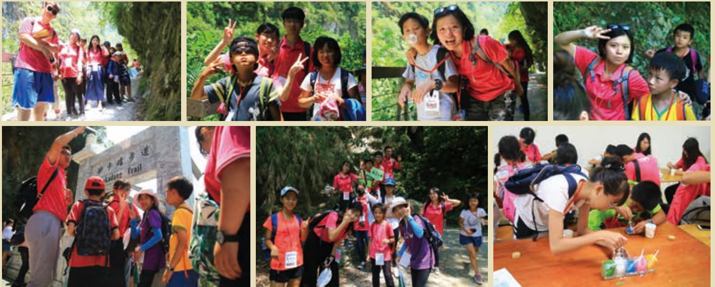
■大手牽小手，太魯閣砂卡礑走透透