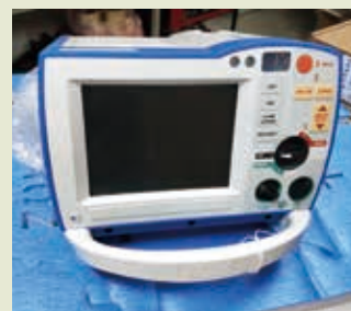
■ 全功能心臟電擊去顫器