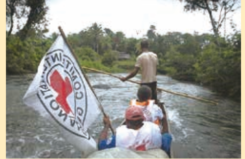
■ + 紅十字特殊標誌神聖不可侵犯

的庫克群島。ICRC是日內瓦公約的草擬者、推動者、執行者及監護者，一直在戰爭或武裝衝突中，與各國紅十字會或紅新月會共同執行人道任務。ICRC在1917年、1944年獲頒諾貝爾和平獎，以表彰其在第一次世界大戰、第二次世界大戰及國際紅十字與紅新月運動百年的貢獻。1919年各國紅十字會及紅新月會共同組成IFRC，在發生重大天然災害的時候，IFRC與各國國家紅十字會或紅新月會共同執行救災復原重建的工作；平時則從事強化醫療、公衛、防備災及社區耐受力的培訓。1963年IFRC與ICRC共同獲得諾貝爾和平獎。196個日內瓦公約締約國政府、ICRC、IFRC及各國國家紅十字會及紅新月會並共同制定國際紅十字與紅新月運動章程，規定國際紅十字與紅新月運動七大基本原則(人道、公正、中立、獨立、志願服務、統一及普遍)及相關的組織架構及運作，聲明國家紅十字會是獨立自主的全國性團體，與政府一起救助日內瓦公約規定的武裝衝突受難者、自然災害的災民等，協助政府致力於傳播國際人道法(以日內瓦公約為核心)，確保國際人道法得到尊重，並共同保護「+」紅十字特殊標誌。