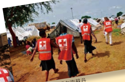
■ 各國紅會志工在南蘇丹