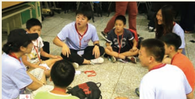
■兩岸青少年共同為洄瀾之旅熱身準備