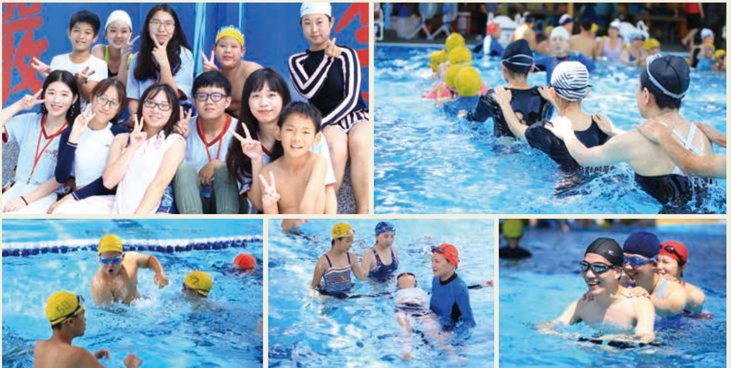
■水上基本救生-戲水十誡，救人五招

但可在潛移默化中，讓大陸青少年了解我國自由、民主體制、對岸青少年朋友也可實地欣賞臺灣渾然天成的美景、體驗臺灣生活及各項美食，同樣的也刺激臺灣青少年對於大陸習俗、環境的想像，激發臺灣青年們向外發展的動