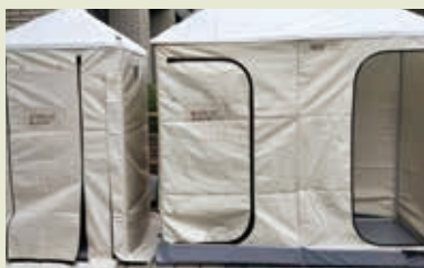
■ 攜帶式衛生保健組及雙人淋浴組