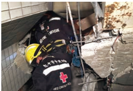
■無畏餘震，救災隊深入維冠金龍大樓搶救生命

為充實國內外重大災害緊急醫療救災能量，本會運用日本赤十字社第2筆捐款，於2018年2月3日捐助臺南成功大學醫學院附設醫院行動醫院總價值高達1,732萬餘元之30項238件設備。另2016年9月至11月，於北高、南投及花蓮縣，進行救災隊城市搜救基礎訓