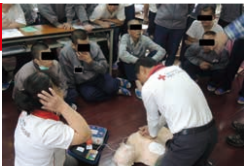
■2位志工教練指導學員CPR+AED技巧