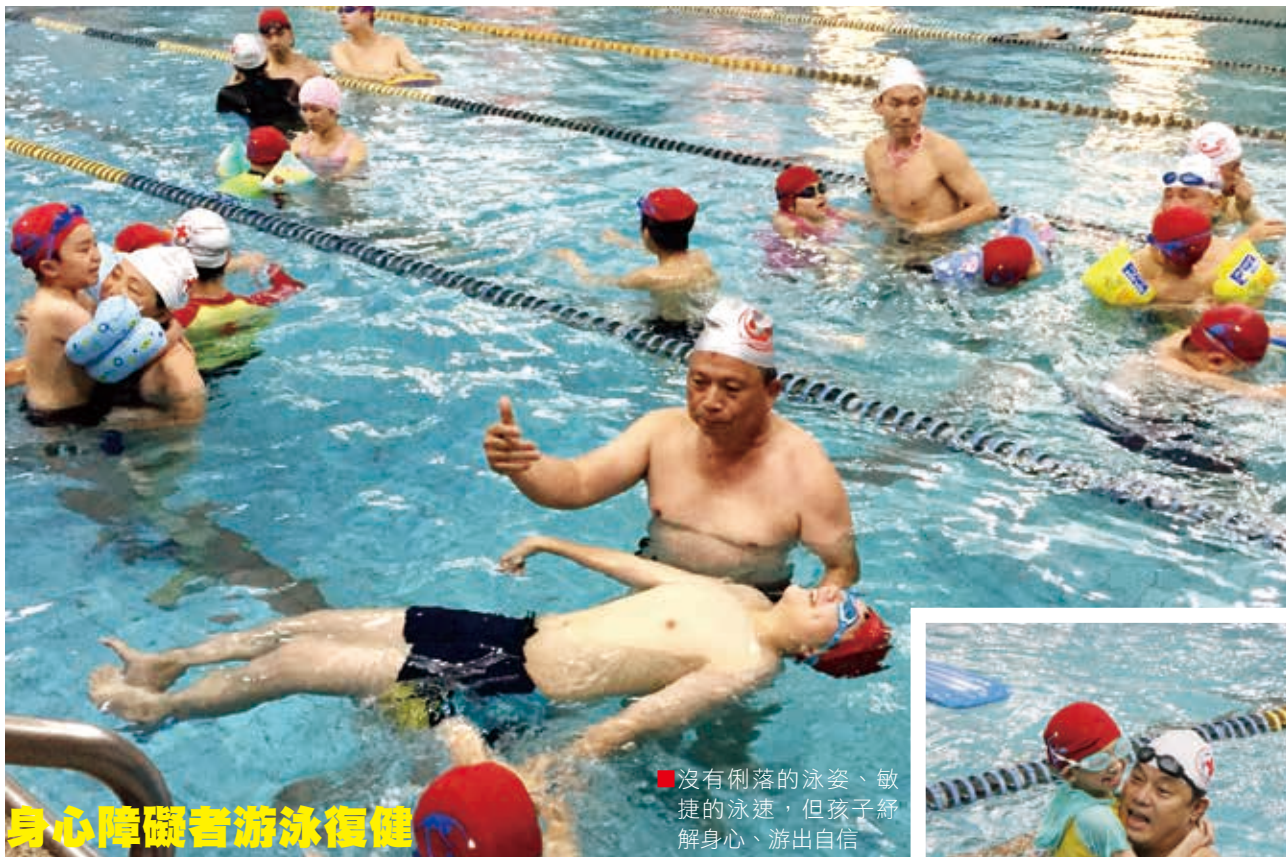
身心障礙者游泳復健