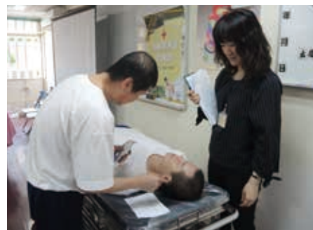
■導師稱讚「大男人也有細膩的一面」