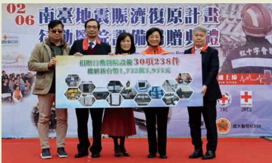
■ 2018.2.3捐贈臺南成大附設醫院行動醫院設備