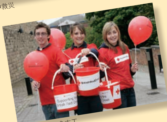
■ 英國紅十字會志工