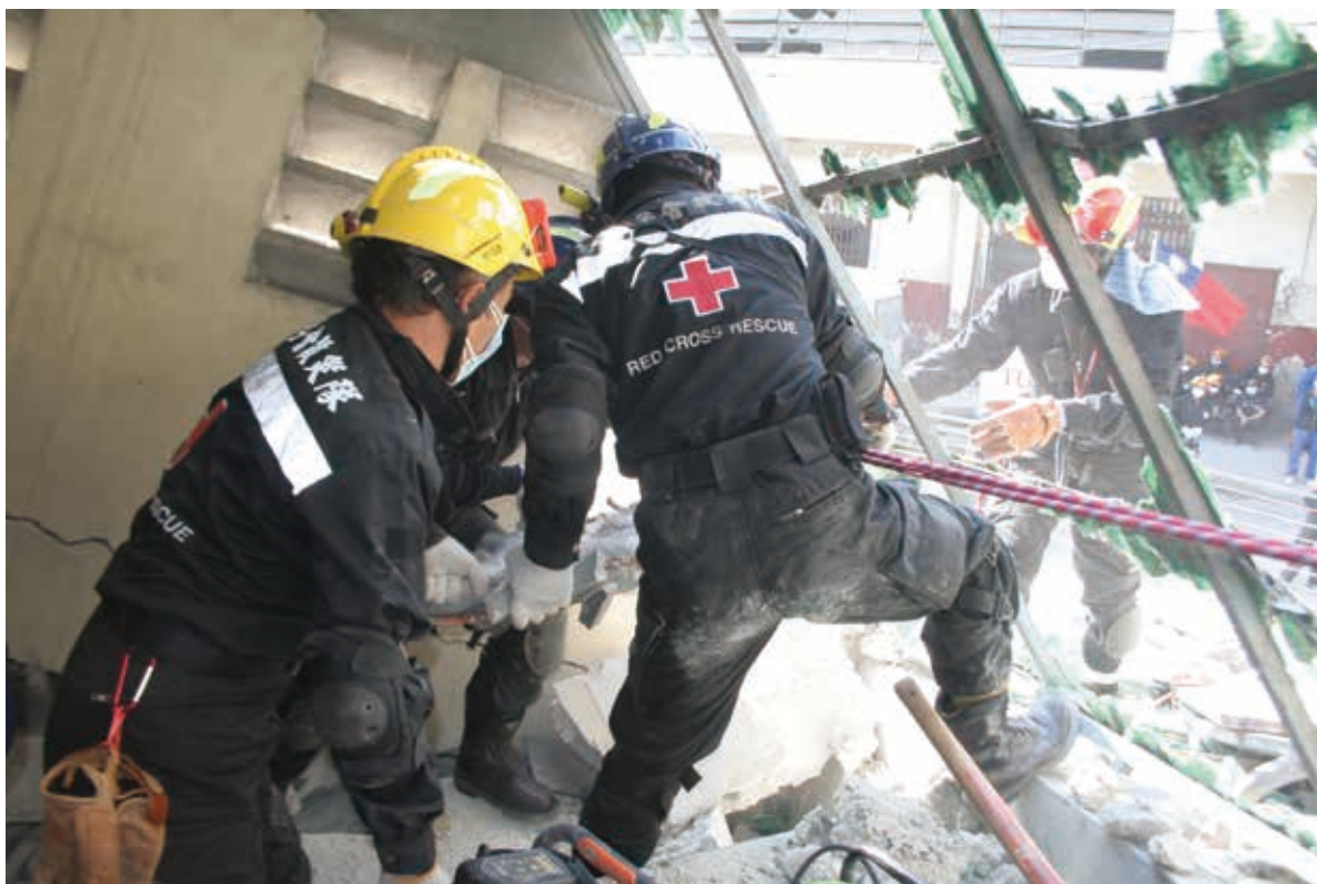
■海地地震，中華民國紅十字會救災隊投入救災

「+」紅十字特殊標誌是ICRC、IFRC及各國紅十字會「專用」且具有「保護性」及「標明性」的人道標誌，不是任何人、任何組織、企業、機關(構)可任意使用的。中華民國紅十字會呼籲政府積極防止及取締冒用、濫用「+」紅十字特殊標誌的行為，並依日內瓦公約制定法律，與我們共同保護「+」紅十字特殊標誌的神聖地位，傳播國際人道法並加速國內法化。